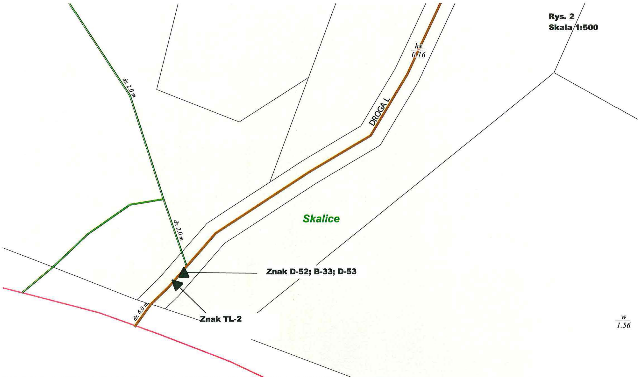
Rys. 2 Skala 1:500